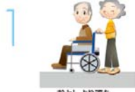
おとしよりのでも