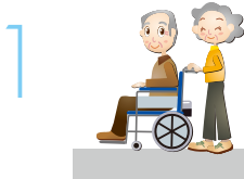
お年寄りのご夫婦に…