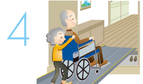
急勾配のスロープで…

アシストホイールは、介護負担軽減が可能な“介護ロボット(移動支援)分野のパイオニア”として、益々期待されています。